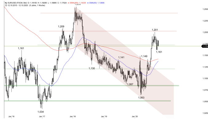
Stand: 16.10.2020, 7:00 Uhr