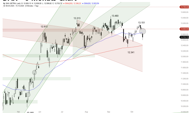
DAX – 6-Monats-Chart

Stand: 16.10.2020, 7:00 Uhr; Quelle: BörseGo AG