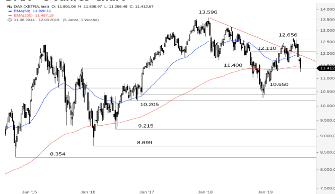
DAX – 5-Jahres-Chart

Stand: 16.08.2019, 7:00 Uhr; Quelle: BörseGo AG