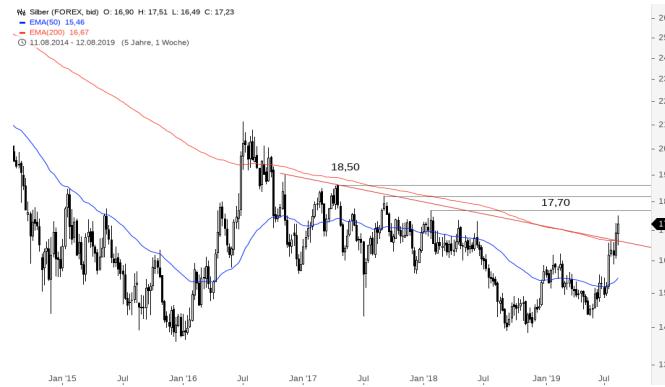
Stand: 16.08.2019, 7:00 Uhr