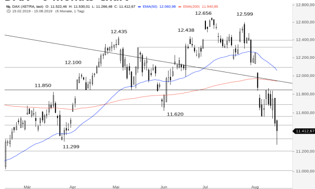
DAX – 6-Monats-Chart

Stand: 16.08.2019, 7:00 Uhr; Quelle: BörseGo AG