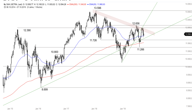
DAX – 5-Jahres-Chart

Stand: 10.10.2019, 7:00 Uhr; Quelle: BörseGo AG