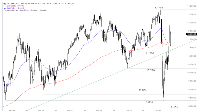
DAX – 5-Jahres-Chart

Stand: 22.06.2020, 7:00 Uhr; Quelle: BörseGo AG