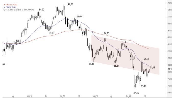
BASF – 5-Jahres-Chart

Stand: 27.08.2020, 7:00 Uhr; Quelle: BörseGo AG