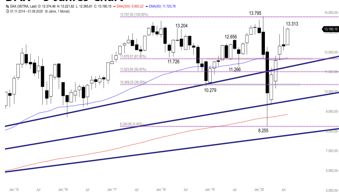
DAX – 5-Jahres-Chart

Stand: 27.08.2020, 7:00 Uhr; Quelle: BörseGo AG