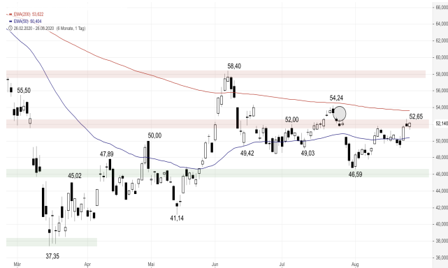
BASF – 6-Monats-Chart

Stand: 27.08.2020, 7:00 Uhr; Quelle: BörseGo AG