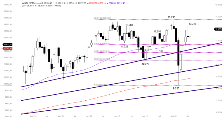
DAX – 5-Jahres-Chart

Stand: 20.08.2020, 7:00 Uhr; Quelle: BörseGo AG