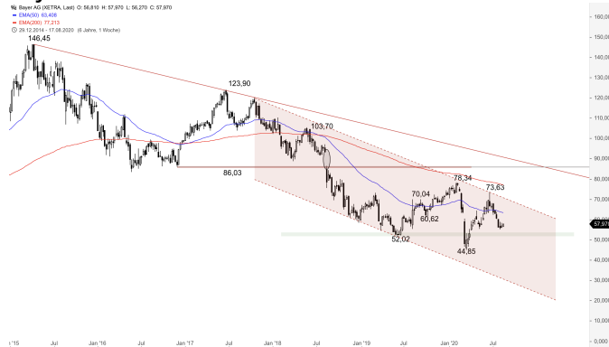
Stand: 20.08.2020, 7:00 Uhr