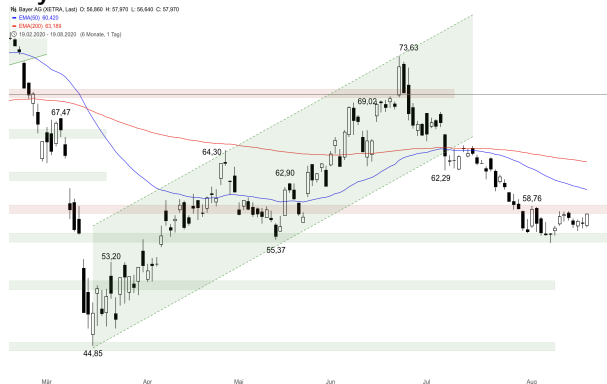
Stand: 20.08.2020, 7:00 Uhr