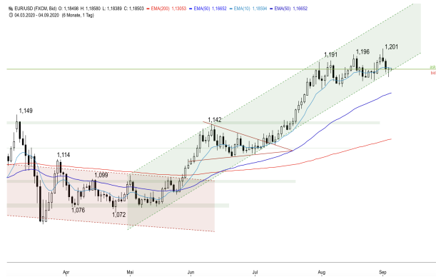
Stand: 04.09.2020, 7:00 Uhr