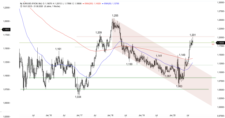
Stand: 04.09.2020, 7:00 Uhr