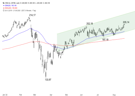
Stand: 24.08.2020, 7:00 Uhr; Quelle: BörseGo AG