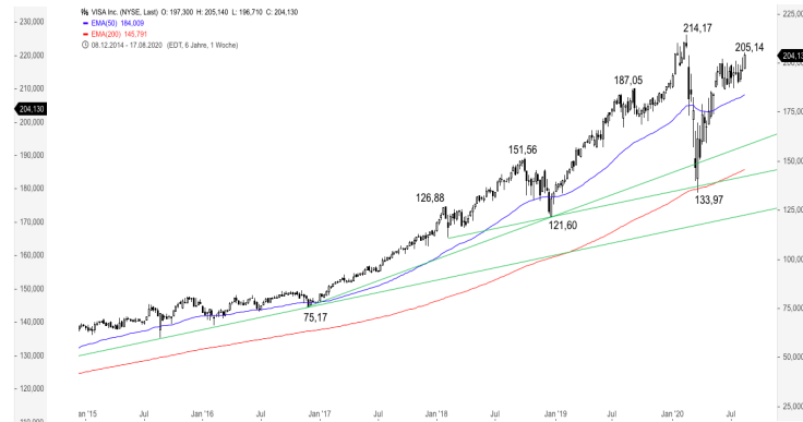
Stand: 24.08.2020, 7:00 Uhr