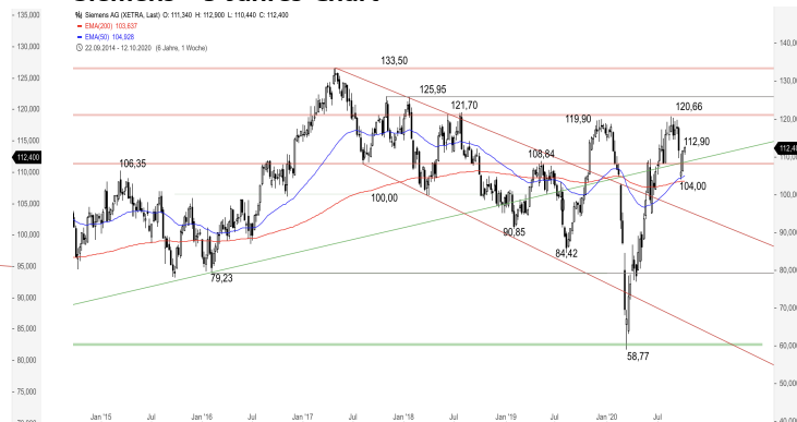
Stand: 15.10.2020, 7:00 Uhr