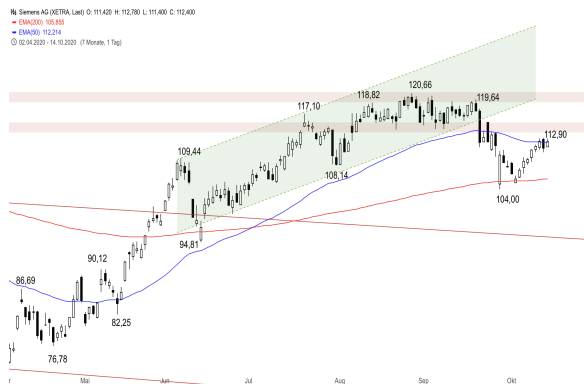
Stand: 15.10.2020, 7:00 Uhr