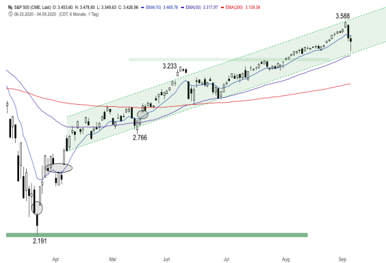
Stand: 08.09.2020, 7:00 Uhr