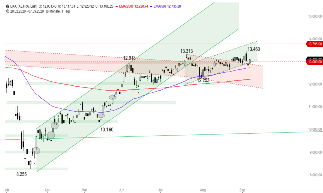
Stand: 08.09.2020, 7:00 Uhr; Quelle: BörseGo AG