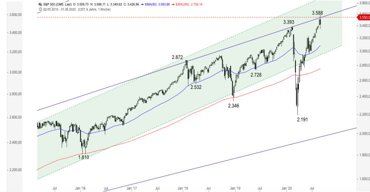
Stand: 08.09.2020, 7:00 Uhr; Quelle: BörseGo AG