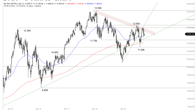
Stand: 08.10.2019, 7:00 Uhr