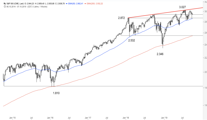
Stand: 08.10.2019, 7:00 Uhr