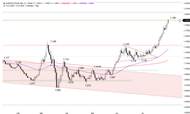
Stand: 31.07.2020, 7:00 Uhr