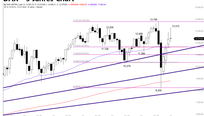
DAX – 5-Jahres-Chart

Stand: 31.07.2020, 7:00 Uhr