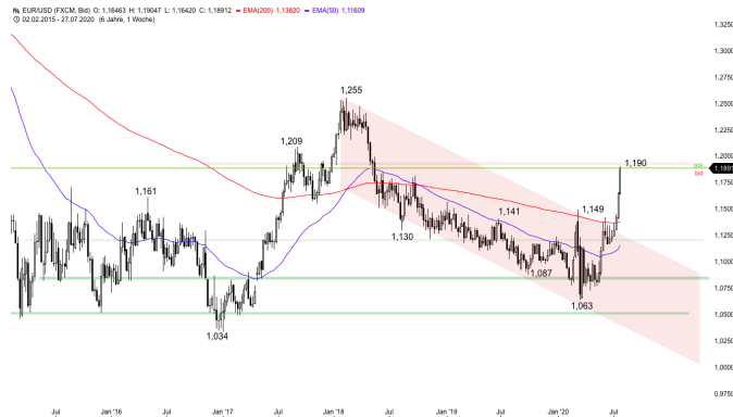
Stand: 31.07.2020, 7:00 Uhr