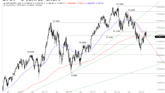
DAX – 5-Jahres-Chart

Stand: 25.03.2019, 7:00 Uhr; Quelle: BörseGo AG