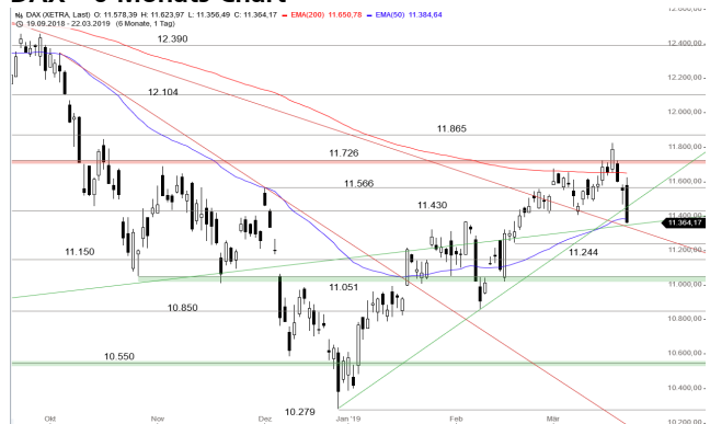
DAX – 6-Monats-Chart

Stand: 25.03.2019, 7:00 Uhr; Quelle: BörseGo AG