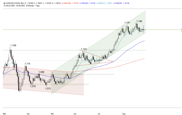
Stand: 28.08.2020, 7:00 Uhr; Quelle: BörseGo AG