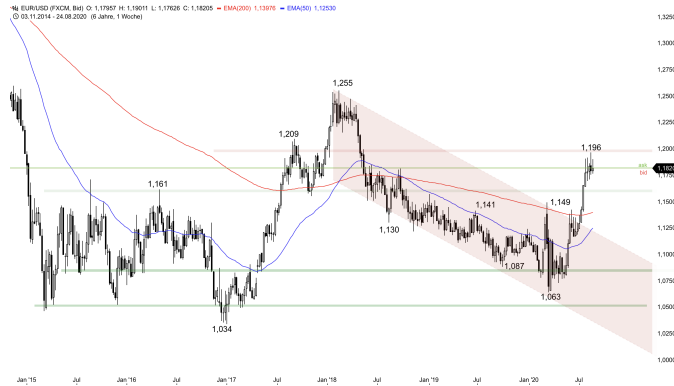
Stand: 28.08.2020, 7:00 Uhr