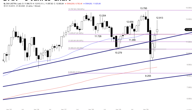
DAX – 5-Jahres-Chart

Stand: 25.06.2020, 7:00 Uhr