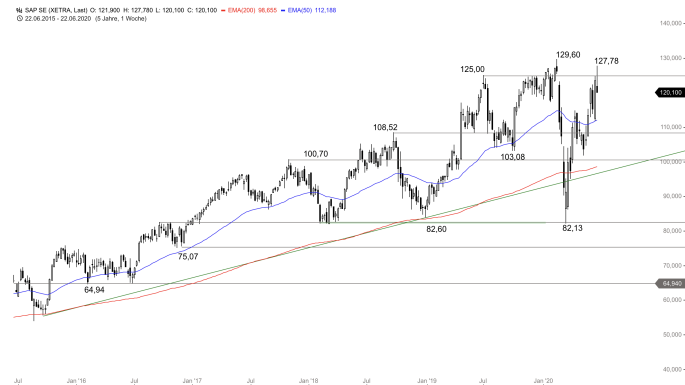
Stand: 25.06.2020, 7:00 Uhr