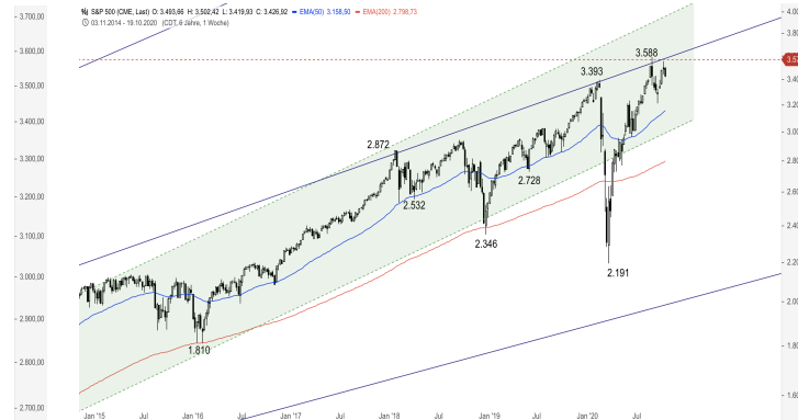
Stand: 20.10.2020, 7:00 Uhr

weiter fortsetzen und zunächst Kurs auf den 50er-EMA im Tageschart bei aktuell 3'375 Punkten nehmen. Wird der 50er-EMA von den Bullen aufgegeben, wäre mit einem weiteren Rücklauf zum 200er-EMA bei aktuell 3'180 Punkten zu rechnen. Im Bereich von 3'180/3'150 Punkten wäre die Korrekturzielmarke nach dem Abpraller vom Fibonacci-Fächer im Wochenchart zu sehen. Durchbrechen die Bären auch den 200er-EMA nach unten, würde zunächst ein Rücklauf bis zur runden Marke bei 3'000 Punkten wahrscheinlich werden. Darunter wäre die noch offene Kurslücke bei 2'865 Punkten die nächste Anlaufmarke. Die Long-Szenarien: Der S&P500 kann sich schnell von den Abgaben des Vortages erholen und die Abwärtskorrektur unter dem 10er-EMA im Tageschart bei 3'450 Punkten beenden. Gelingt im Tageshandel ein nachhaltiger Anstieg über den 10er-EMA, wäre mit einem erneuten Angriff der Bullen auf den steigenden Trendkanal zu rechnen.