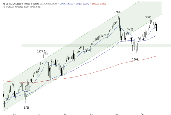
Stand: 20.10.2020, 7:00 Uhr