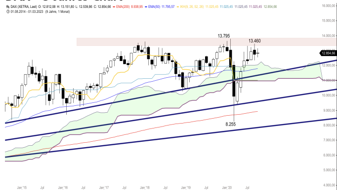
Stand: 20.10.2020, 7:00 Uhr