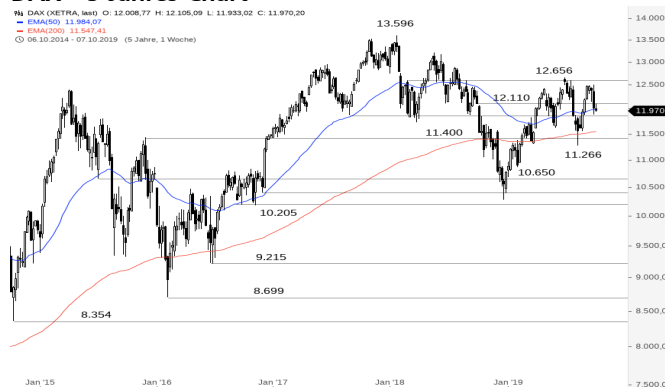
DAX – 5-Jahres-Chart

Stand: 09.10.2019, 7:00 Uhr; Quelle: BörseGo AG