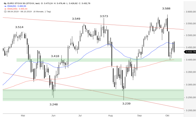
Stand: 09.10.2019, 7:00 Uhr