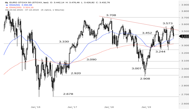
Stand: 09.10.2019, 7:00 Uhr